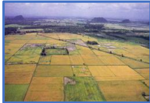
เมืองอู่ข้าวอู่น้ำแดนใต้แห่งสยาม จากอดีตถึงปัจจุบัน