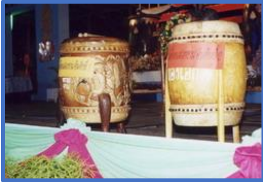
โพน หรือที่รู้จักกันดีว่า กลอง นันเอง

นิยมทำกันทั่วไปในภาคใต้ ในช่วงเดือน 11 (แรม 1 ค่ำ เดือน 11) การลากพระมีอยู่ 2 ลักษณะ ตามความเหมาะสมของภูมิประเทศ คือ ลากพระทางบกและลากพระทางน้ำ สำหรับจังหวัดพัทลุงเป็นการลากพระทางบก ซึ่งจะมีการตีโพน (กลอง) เพื่อควบคุมจังหวะในการลากพระ ขบวนพระลากของแต่ละวัดก็จะมีผู้ตีโพนอยู่บนขบวน และเมื่อผ่านวัดต่างๆ ก็จะมีการตีโพนทำทายกัน ทำให้มีการแข่งขันตีโพนเกิดขึ้น และทางจังหวัดพัทลุงก็ได้จัดให้มีการแข่งขันตีโพนขึ้นเป็นประจำทุกปี ในเทศกาลลากพระเดือน 11