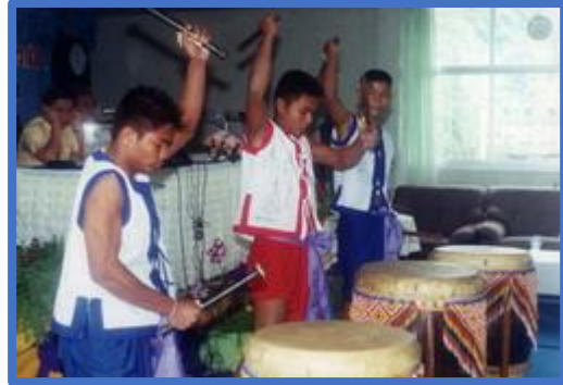
การแข่งขันตีโพน