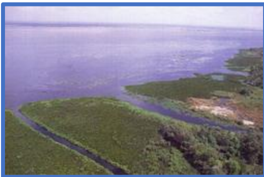
ผืนดินจรดทะเลสาบสงขลา หล่อหลอมวิถีชีวิตคนเมืองลุง