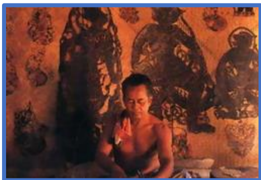
การแกะตัวหนัง

เป็นงานที่จัดขึ้นในช่วงต้นเดือนเมษายนของทุกปี กิจกรรมภายในงานจะเป็นการจัดนิทรรศการ การละเล่นพื้นบ้านปักษ์ใต้ และการประกวดหนังตะลุงซึ่งได้รับความสนใจจากศิลปินพื้นบ้านเข้าร่วมการ ประกวดมากมาย งานดังกล่าวนี้จะจัดขึ้น ณ บริเวณสนามหน้าศาลากลางจังหวัดพัทลุง