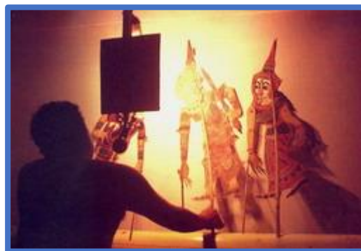
การเชิดหนังตะลุง