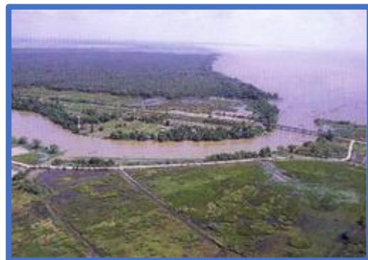
ผืนแผ่นดินและผืนน้ำอันอุดมสมบูรณ์ หล่อเลี้ยงสรรพชีวิต