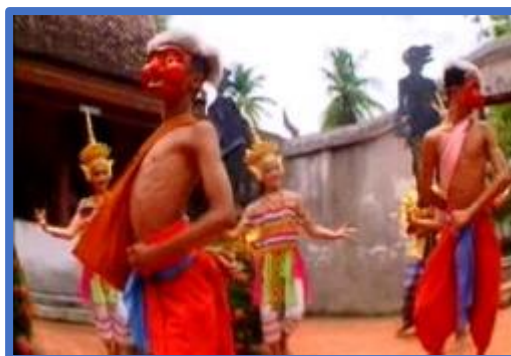
การแสดงมโนราห์ที่นับวันจะหาดูได้ยาก